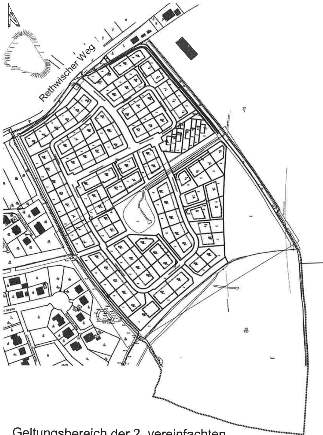
Geltungsbereich der 2. vereinfachten Änderung Bebauungsplan Nr. 85