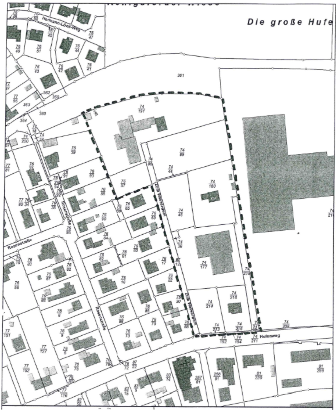
Erweiterter Geltungsbereich der 2. Änderung des Bebauungsplanes Nr. 73